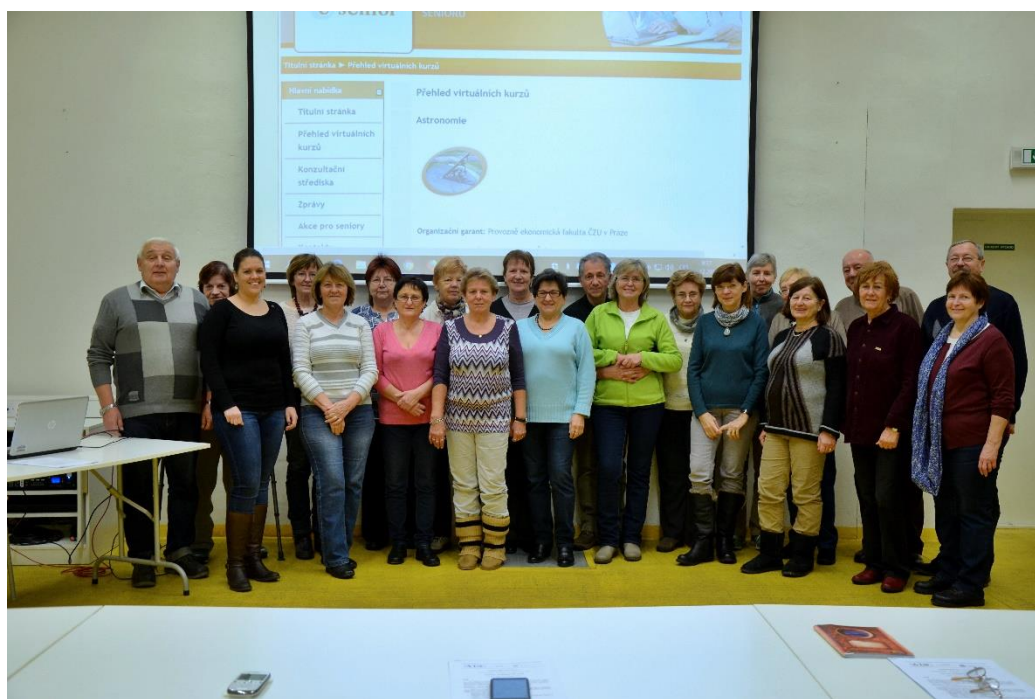
Studenti Virtuální univerzity 3. věku