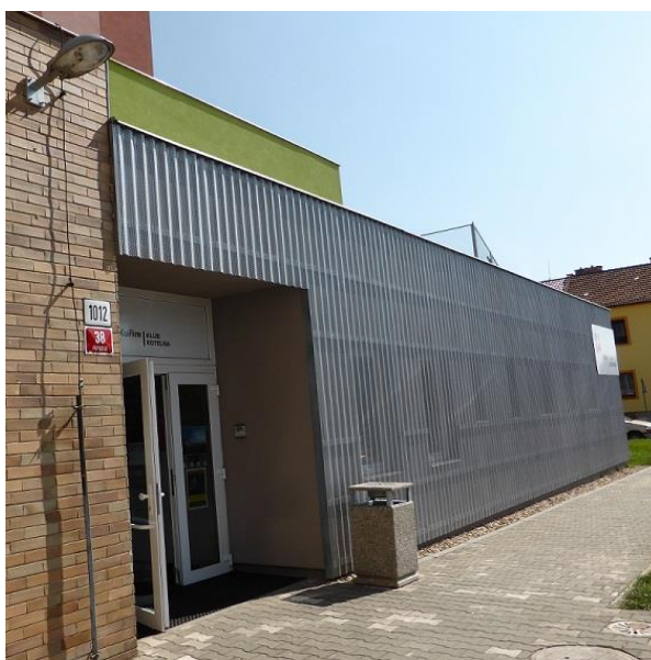
Vchod do Klubu Kotelna

Stejně jako v minulých dvou letech i v roce 2017 platí, že kulturní oddělení Městské knihovny Kuřim sídlí v přilehlém Klubu Kotelna. Jedná se o budovu bývalé plynové kotelny v sousedství knihovny, která prošla v roce 2014 celkovou rekonstrukcí.