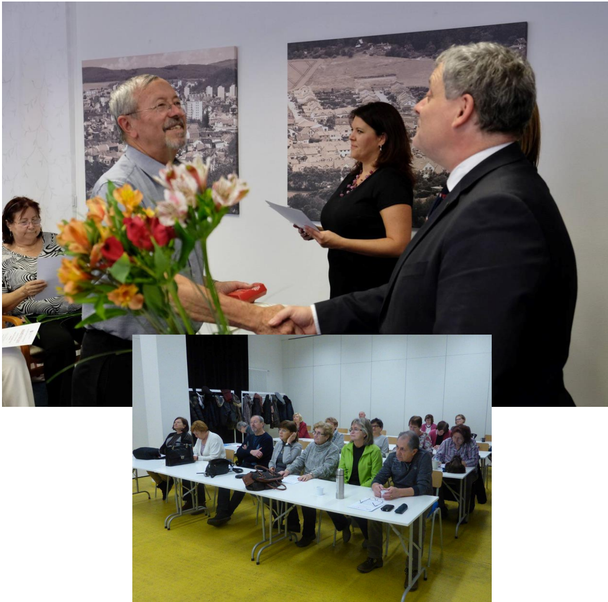
Virtuální univerzita 3. věku

Virtuální univerzita 3. věku – České dějiny a jejich souvislosti