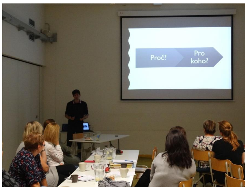
Porada profesionálních knihoven

Proběhly porady profesionálních i obecních knihoven. Regionální knihovna organizovala samostatné vzdělávací akce, odbornou exkurzi a zajišťovala metodickou pomoc při přípravě kulturních a vzdělávacích činností.