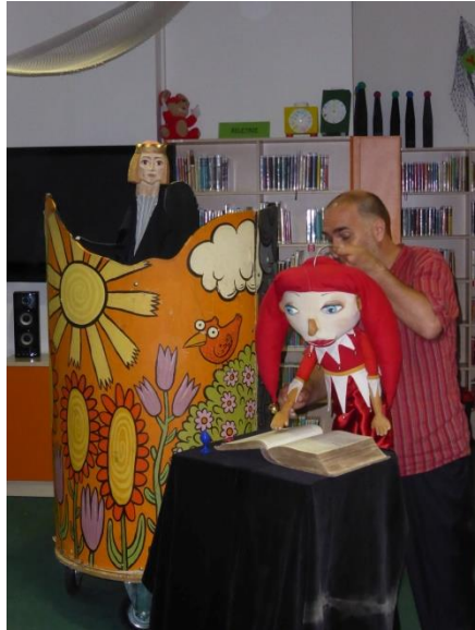
Kašpárek a drak

Divadelní představení ke Dni dětí – Kašpárek a drak.