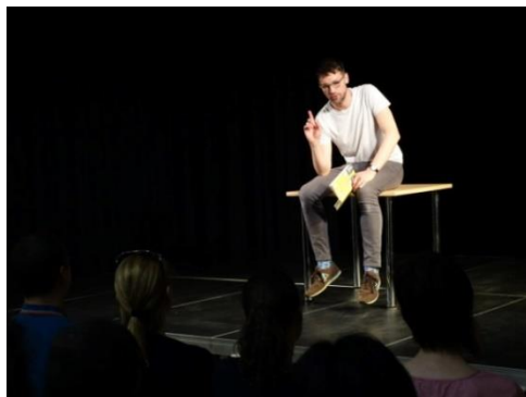
Co by můj syn měl vědět o světě

Listování – Co by můj syn měl vědět o světě, Svatá Barbora