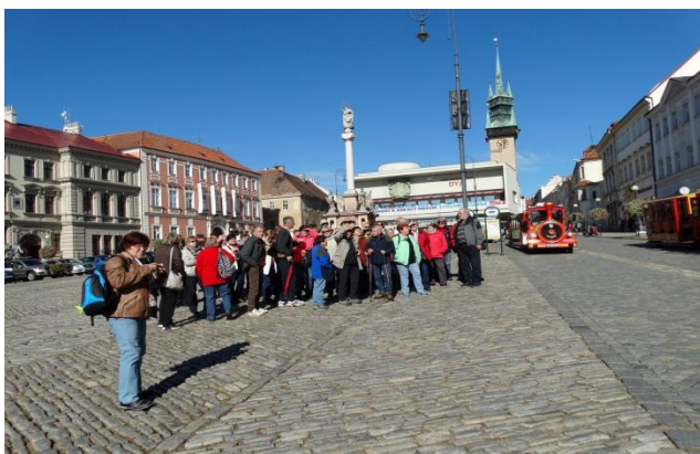
Zájezd pro seniory - Znojmo

Zájezdy pro seniory – Znojmo, Kroměříž, na divadelní představení Něco za něco, Králova řeč, Žitkovské bohyně