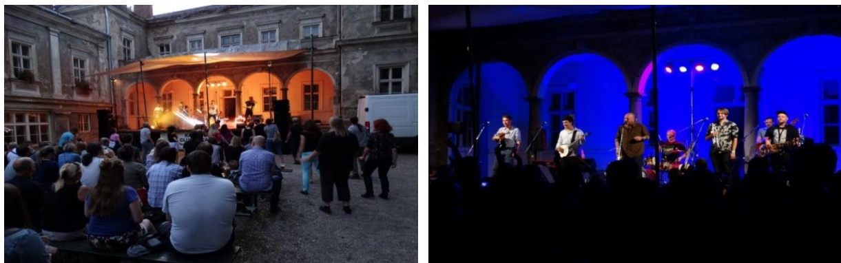
Zrní a Poletíme?

Letní kino – Tátova volha, Star Wars: Poslední z Jediů, Máří Magdaléna, Hmyz, Čertoviny, Black Panther, Nejtemnější hodina, Králíček Petr, Tři billboardy kousek za Ebbingem, Hastrman