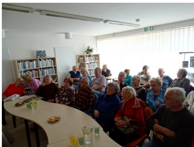
Vzpomínání na starou Kuřim